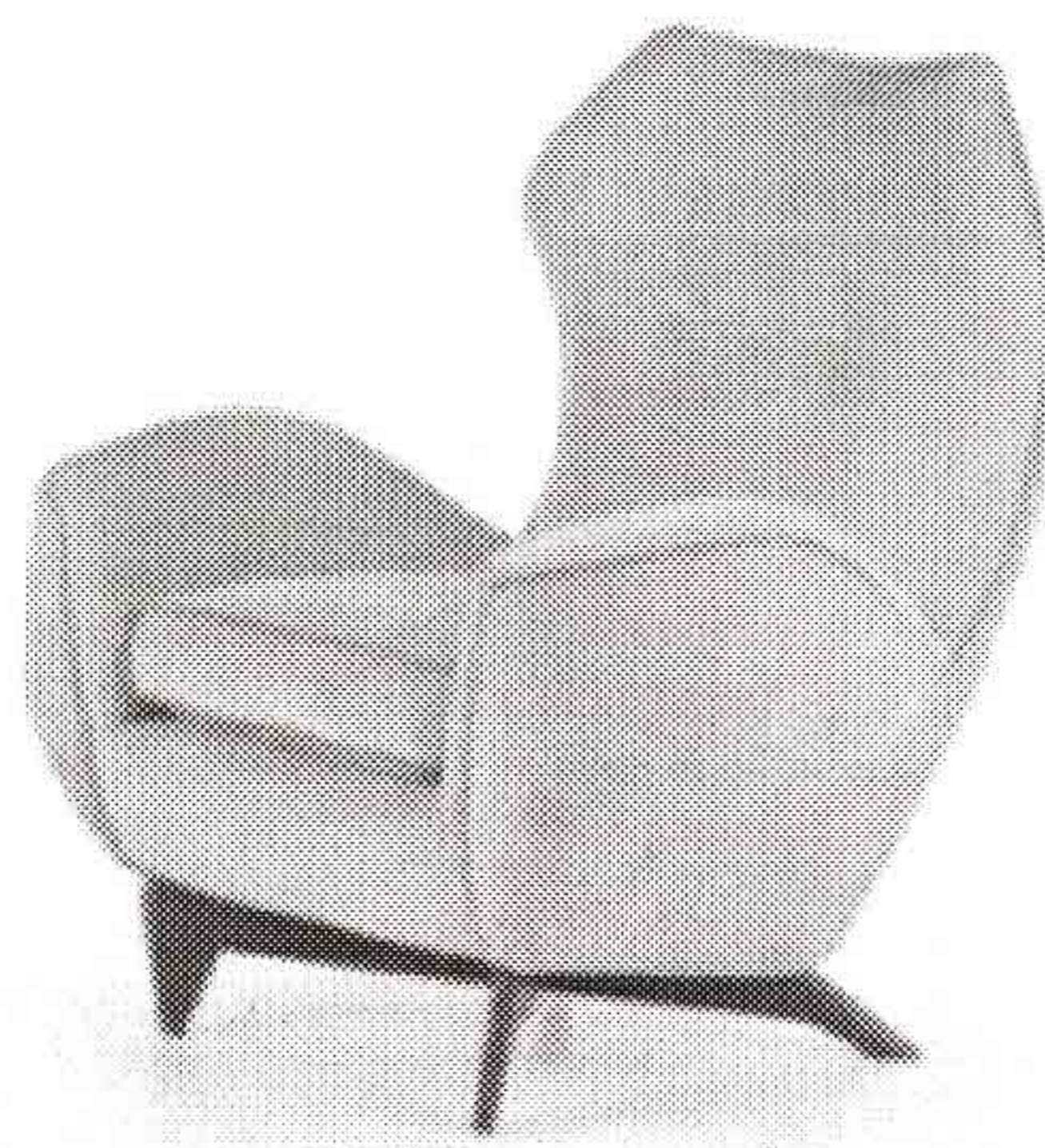
F. Campo e C. Graffi Poltrona Anni '50-'60

Una "toccata e fuga" nel primissimo '900 con un importante mobile - vetrina di Carlo Zen (esposto nel 1902 alla Fiera delle arti decorative di Torino), un interessante passaggio attraverso gli arredi dagli anni '30 (Atelier Borsani, Mobilificio Colli di Torino), per approdare poi al mobile della produzione post bellica, che vede la nascita del design propriamente detto. Qui, i protagonisti assoluti sono i materiali più tradizionali che si fondono con quelli di nuova concezione. Esempio ne è la serie di tavoli "Ellisse" di Claudio Sormani per Salocchi, dove il piano in marmo incontra una base in acciaio spazzolato e un cilindro in plexiglass cavo al suo interno, che sorregge il piano.